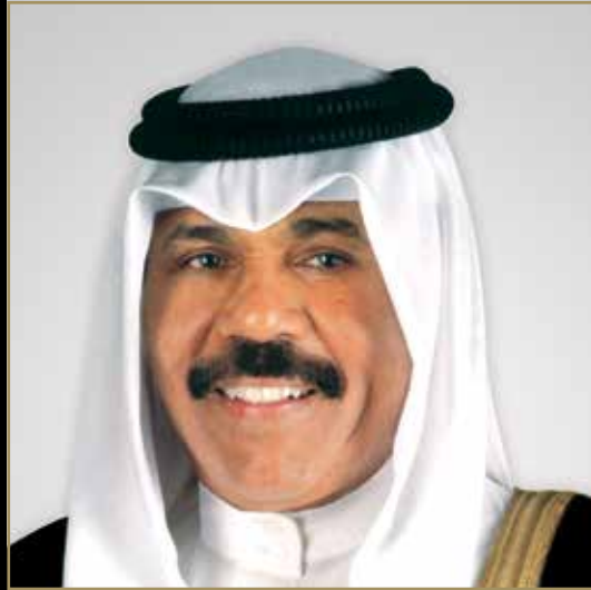
سمو الشيخ نواف الأحمد الجابر الصباح ولي عهد دولة الكويت