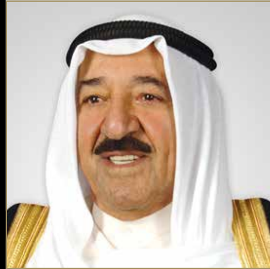
صاحب سمو الشيخ صباح الأحمد الجابر الصباح أمير دولة الكويت